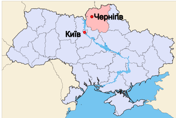
Рисунок 1. Схема місця розташування нового заводу

харчових продуктів FDA. Забезпечена висока автоматизація процесу.